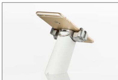
Kompatibel mit Shuko RX Bracket für extra Sicherheit