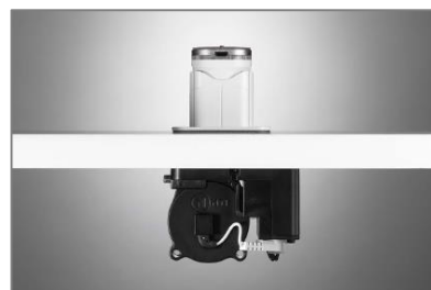
Freedom Micro UM