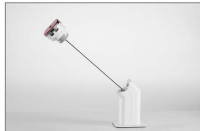
Freedom Micro (Alarming Puck)