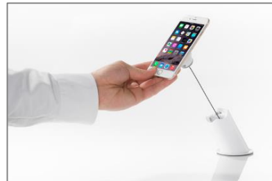
TruFeel AirTether™ schwer durchtrennbar