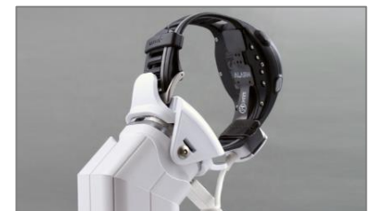
Freedom Micro FlexTech